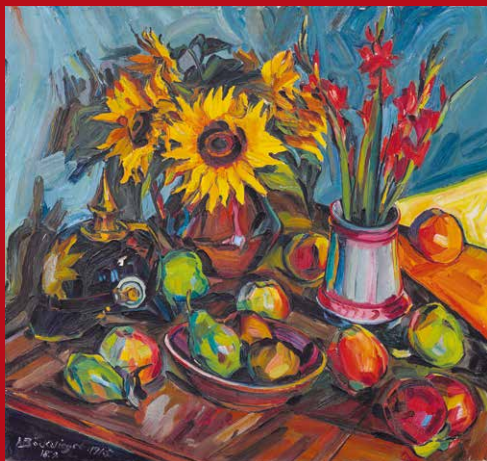
Stillleben mit Pickelhaube, 1915 Öl auf Leinwand, 82 x 86 cm Sammlung Bunte

Peter August Böckstiegel (1889 – 1951) zählt als Maler zu den herausragenden Vertretern der zweiten Generation des deutschen Expressionismus. Böckstiegel wuchs in bäuerlichen Verhältnissen in Werther bei Bielefeld auf. Nach einer Ausbildung zum Maler und Glaser besuchte er die Kunstgewerbeschule in Bielefeld. Sein Lehrer Ludwig Godwols erkannte Böckstiegels ungewöhnliches künstlerisches Talent und förderte ihn.