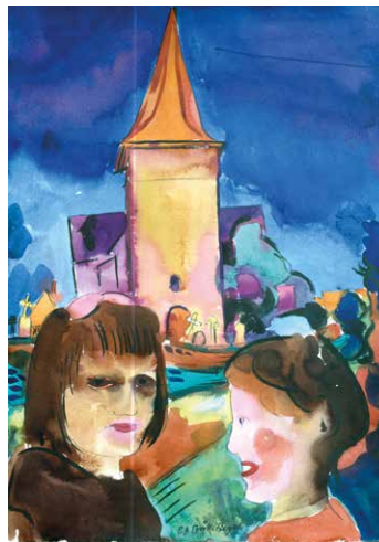
Dorf Bergkirchen, um 1924 Aquarell, 76,5 x 54 cm Peter-August- Böckstiegel-Stiftung, Werther

Mit seiner westfälischen Heimat blieb Böckstiegel eng verbunden. Die Winter pflegte er in Dresden zu verbringen, im Sommer lebte er in Werther. Immer wieder hielt er seine Eltern und seine eigene Familie, aber auch die von harter Arbeit geprägte Landbevölkerung in seinen markanten, farbsprühenden Gemälden, Aquarellen und Holzschnitten fest.