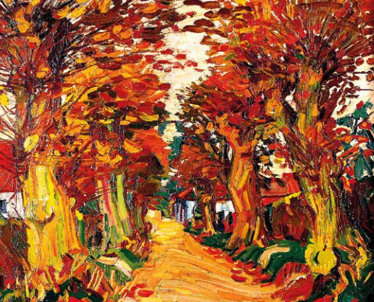
Lindenallee, 1911 Öl auf Leinwand 66,3 x 84 cm Privatbesitz