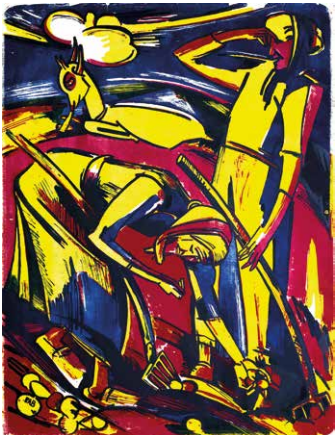
Kartoffelernte, 1920 Farblithographie Tusche mit Pinsel 69,7 x 54 cm Peter-August- Böckstiegel-Stiftung

TERMINE: Dienstag 7. Februar, 21. Februar, 28. März, 11. April jeweils 19 Uhr